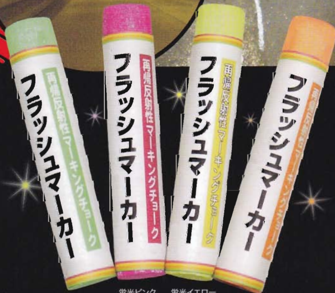
蛍光グリーン 蛍光ピンク 蛍光イエロー 蛍光オレンジ