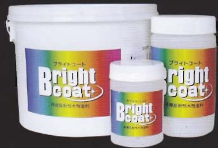
塗れる反射材 水性反射カラー塗料