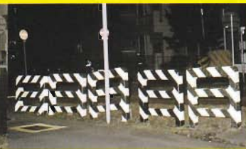
夜間(ストロボ撮影)