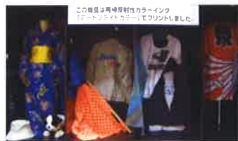
フラッシュ無しで撮影