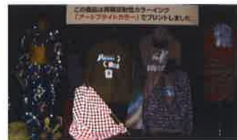
フラッシュ有りで撮影